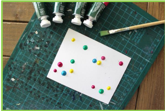
Schritt 3: Malen, Zeichnen, Kritzeln, Bekleben