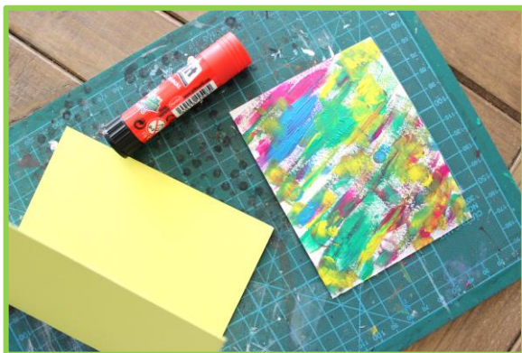
Schritt 4: Fertiges Bild auf die Karte kleben