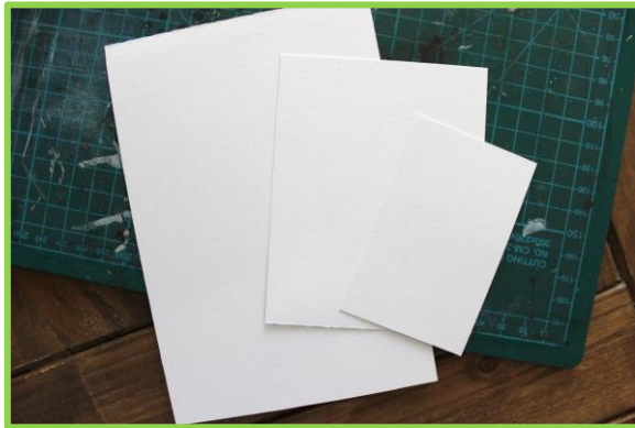
Schritt 1: Format auswählen